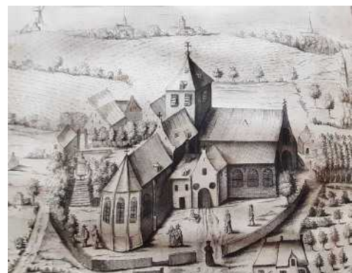
CIMETIÈRE DE LAEKEN