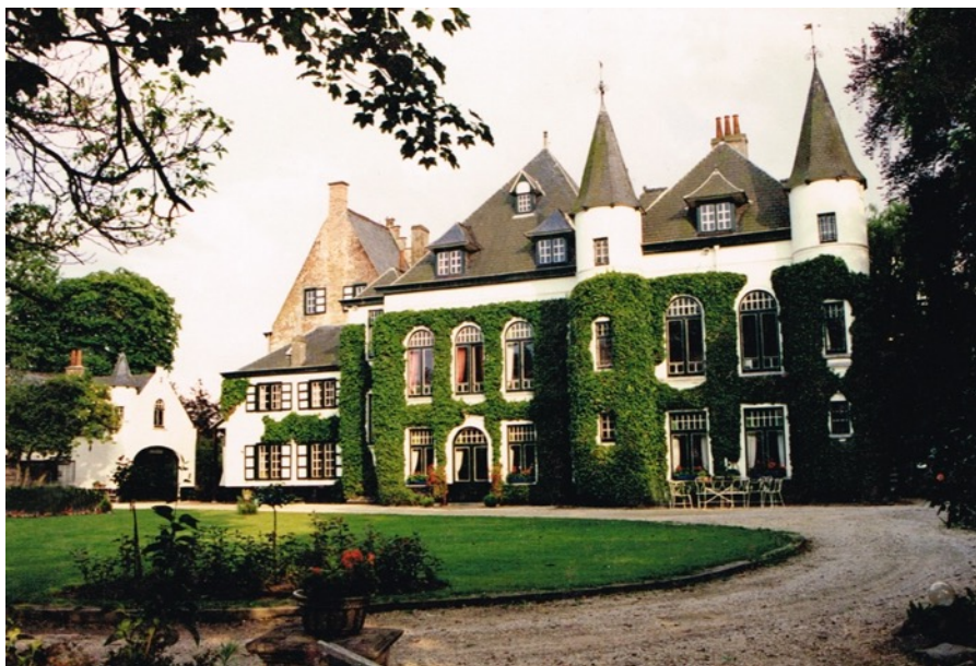
Le Vieil Hermitage à Gentbrugge